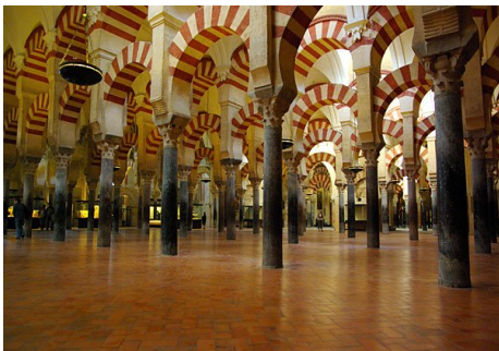
Grande mosquée de Cordoue

En 622, Mohamed, le futur Prophète de l'Islam, fuit La Mecque pour Médine ( il ne nous reste plus que 4 secondes ) Son message se durcit et devient conquérant. En moins d'un siècle, cette force naissante va bousculer des structures vieillissantes et des empires millénaires pour conquérir tout le Moyen Orient, l'Égypte, l'Afrique du Nord et l'Espagne avant d'être arrêtés à Poitiers (ouf !).