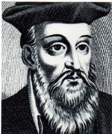
Figure emblématique de la Renaissance, Michel de Nostredame dit Nostradamus, originaire de Saint-Rémy-de-Provence, s'établit dans la cité salonaise à l'âge de 44 ans et y demeure jusqu'à sa mort en 1566. L'étude de l'astrologie l'amènera à publier ses fameuses « Centuries ». Dans cette maison, dix scènes animées par un support audiovisuel illustent sa vie et son œuvre.

Déjeuner au restaurant à l'intérieur la cité.