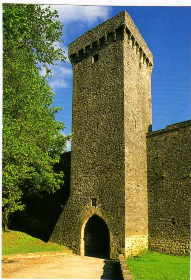
LA COUVERTOIRADE : les remparts (Aveyron)