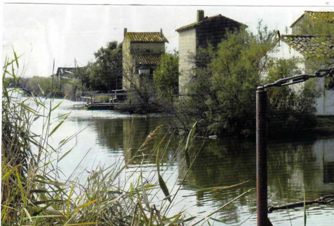
Au milieu des roseaux et des tamaris, le long du canal, les petites maisons et cette atmosphère de bout du monde recherchée par les "cabaniers".

Marchez environ 500 m. Le chemin tourne légèrement, prenez à gauche un sentier traversant de nouvelles zones humides. Au bout d'un quart d'heure apparaît sur votre droite le domaine de Tartuguière que vous délaissez. Contournez une butte par la gauche: vous retrouvez le canal et la piste qui ramène au parking par un autre pont. Attention: la balade est à éviter après une période pluvieuse.